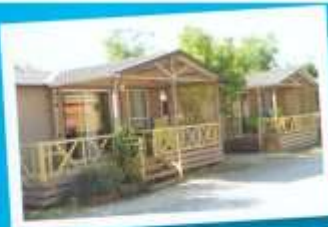
Le Pont d'Arc à environ 25 km

Rivières, descentes des Gorges en Canoë-kayak, canyoning, équitation, spéléologie, balades, visites de grottes et de châteaux, villages pittoresques, musées... Gastronomie.