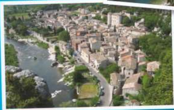
Vogüé village à Terril